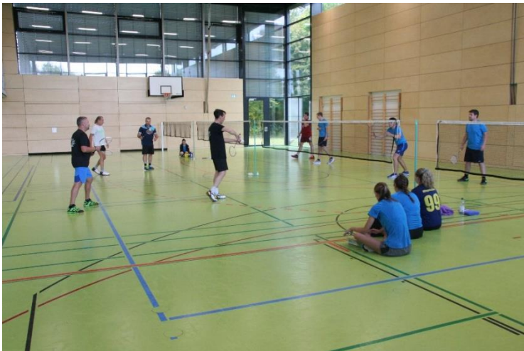
Erstes Punktspiel in der Gustav-Benz-Halle

Beide Spiele endeten 2:6. Aber der Spaß stand im Vordergrund und wir hoffen alle auf eine Saison ohne großer Beeinträchtigungen.