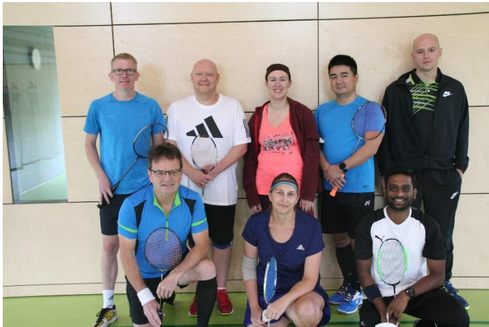
Die erste Mannschaft