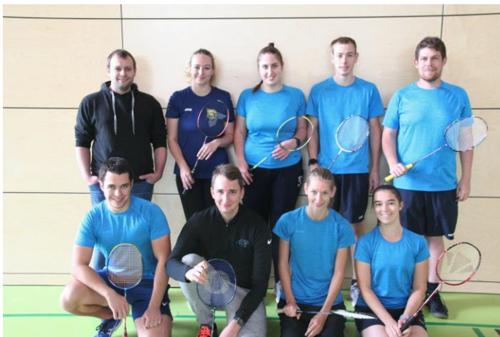
Die zweite Mannschaft